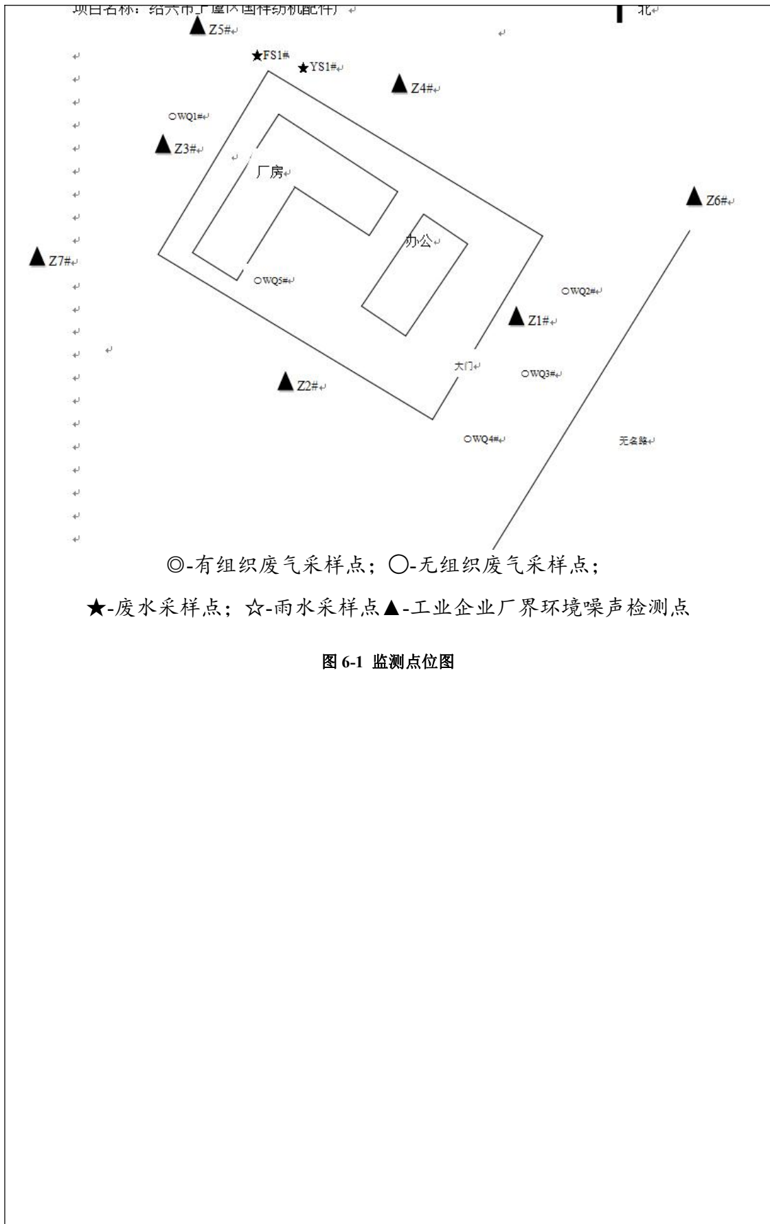
图 6-1 监测点位图